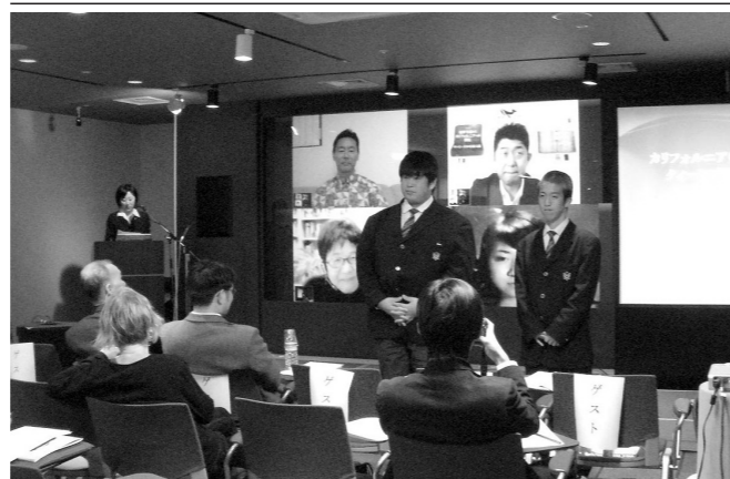
高校生を代表して移民研究を通して学んだことを発表

この中で、太田町公立中学校と和歌山大学観光学部主催のシンポジウム「和歌山から世界への移民」先人の歴史を学び、新たな国際交流へ！が和歌山市のフオルティシマ3階フュージョンミュージアム(ニッポンストーリー)のホールで開催された。