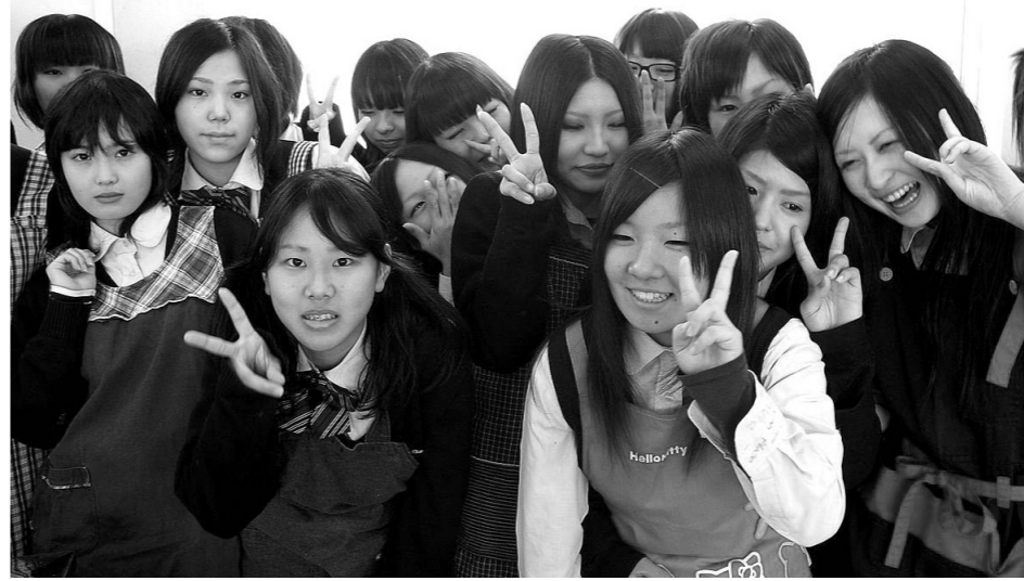
フードデザイン選択生