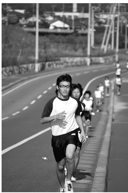
男子の激しい優勝争い

今年度のマラソン大会が男子169人、女子132人の参加で実施された。昨年同様、新宮町の周回コースで男子6キロ、女子4キロの2種目で競い合った。本校では全生徒に自分の目標タイムを設定させ、練習の中で少しずつ目標に近づけるよう指導している。そのため成績上位者だけでなく、目標タイムの達成も多かった。